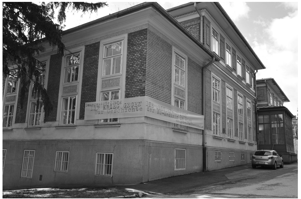
Der Sitz der Gedenkstätte Steinhof im V-Gebäude der ehemaligen Heil- und Pflegeanstalt Am Steinhof (heute Otto-Wagner-Spital)

Spätestens seit dem Beginn des neuen Jahrtausends gehört der gesellschaftliche Schweigepakt über die Verbrechen der Medizin im Nationalsozialismus der Vergangenheit an. Die Entwicklung seit 1945 verlief dabei nicht geradlinig. Vielmehr war sie von mehreren Phasen gekennzeichnet, in denen die gesellschaftlichen Auseinandersetzungen um die Deutungshoheit über die nationalsozialistische Vergangenheit und damit über den Status von Tätern (vereinzelt Täterinnen), Mitläufern und Mitläuferinnen sowie Opfern in unterschiedlicher Intensität geführt wurden und unterschiedliche Ergebnisse mit sich brachten. Die heißeste Phase dieser Auseinandersetzungen war die unmittelbare Nachkriegszeit. Der vollständige militärische und politische Zusammenbruch des Deutschen Reiches, die frischen Erinnerungen an die Verbrechen der Nationalsozialisten und die Leiden der Verfolgten sowie nicht zuletzt die Präsenz der alliierten Besatzungsmächte führten dazu, dass während einer wenige Jahre dauernden antifaschistisch geprägten Phase die ehemaligen Nazis mit dem Verlust ihres gesellschaftlichen Status, ihrer politischen Rechte und nicht selten mit strafrechtlicher Verfolgung bedroht waren. Von rund 700.000 NSDAP-Mitgliedern wur-