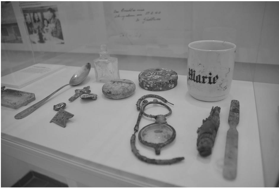
Ausgrabungsobjekte vom Gelände der ehemaligen Tötungsanstalt Hartheim

des Otto-Wagner-Spitals, illustriert eine Tendenz zu einer einseitigen Fokussierung auf die Opfer der Kinder-„Euthanasie“ zu Lasten anderer, zahlenmäßig viel größerer Opfergruppen. Auch eine namentliche, individuelle Würdigung der Ermordeten ist bisher nur für die Spiegelgrund-Opfer verwirklicht, im Rahmen eines von Waltraud