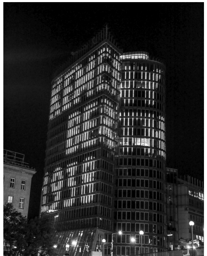
Der UNIQA-Tower in Wien-Leopoldstadt, Untere Donaustraße 21, als „Namensturm“

www.memento.wien – MEMENTO Wien macht Daten zur Ausgrenzung, Vertreibung und Verfolgung während der NS-Zeit in Wien mobil zugänglich und bietet die Möglichkeit, die Geschichte der eigenen Umgebung interaktiv zu erforschen.