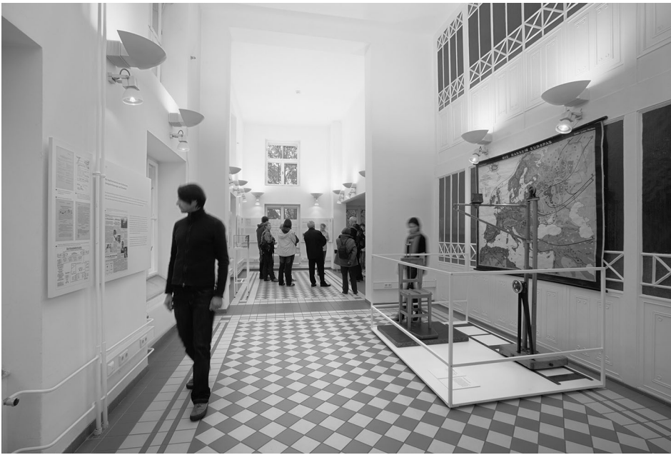
Blick in die Dauerausstellung der Gedenkstätte

Stigma der „Erbkrankheit“ und „Minderwertigkeit“ zu kämpfen, ihnen blieb jede Anerkennung oder gar Entschädigung verwehrt. Auch die Verhältnisse in den Jugendfürsorgeanstalten, wo zahlreiche Kinder und Jugendliche Misshandlungen und Vernachlässigung erlitten hatten, änderten sich nach der Befreiung kaum – die Interviewpassagen in diesem Band belegen das eindrucksvoll. Im Nürnberger Ärzteprozess, der einer internationalen Öffentlichkeit die Grausamkeit der NS-Medizinverbrechen vorführte, spielten die Vernichtungsaktionen gegen PsychiatriepatientInnen und andere gesellschaftliche Randgruppen eine vergleichsweise marginale Rolle.