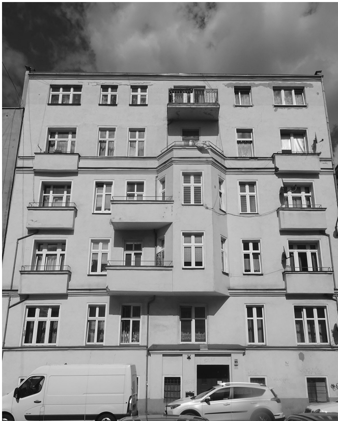
Ehemaliges „Judenhaus“ in der Kopischstraße 65 (heute ul. Stalowa), Aufnahme 2018. Das Haus wurde in dieser Funktion bis maximal 1943 genutzt.