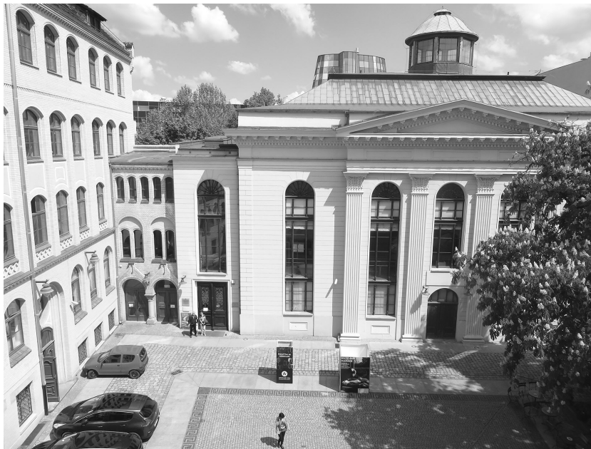
Synagoge Zum Weißen Storch 2016 Maria Luft

Die Wallstraße mit der Synagoge Zum Weißen Storch und dem Jüdisch-Theologischen Seminar war spätestens seit dem 19. Jahrhundert das Zentrum des jüdischen Breslau. Verschiedenste jüdische Einrichtungen und Häuser befanden sich in ihrer unmittelbaren Nähe. 1941 standen etliche dieser Häuser