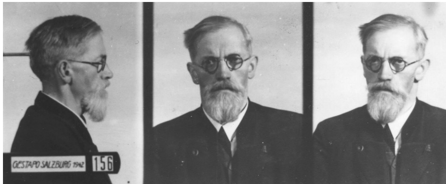
Josef Reischenböck (1890–1943). Wegen seiner Widerstandstätigkeit gegen das Regime in München hingerichtet. Seine Leiche wurde schrittweise bis mindestens 1949 in Innsbruck anatomisch verwertet.